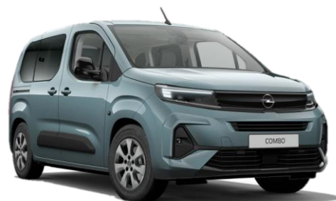
Modrá Kiama (M6M0) 500 €