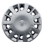
16" x 6,5 čierne ocelové disky so celoplošnými krytmi (DZJN)