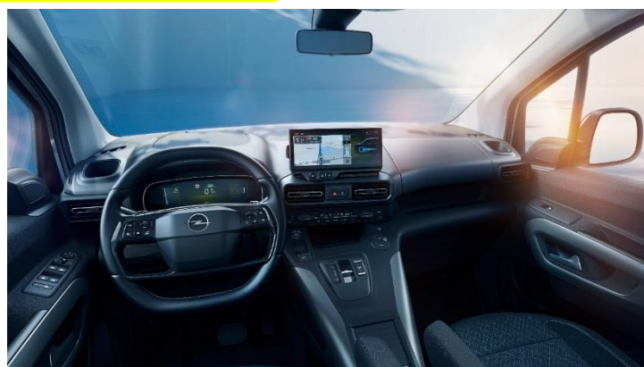
Interiér šedý Mistral Gray Uplevel s šedými metalickými prvkami CQFY GS – 0 €