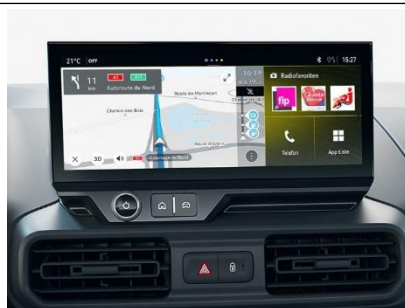
Multimediálny systém NAVI IVI