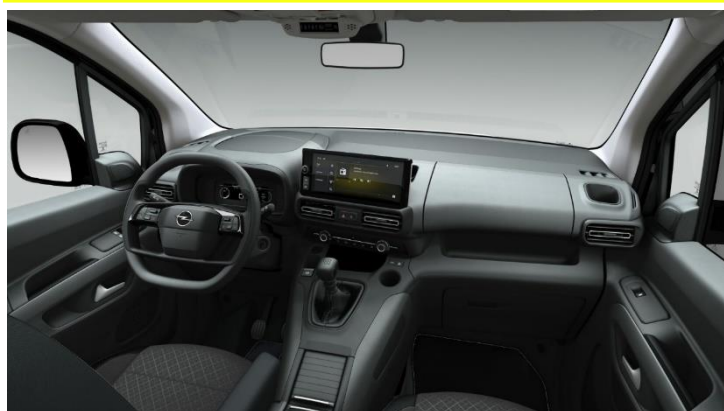
Interiér šedý Mistral Gray CMFY / CQFY Edition / Edition Plus – 0 €