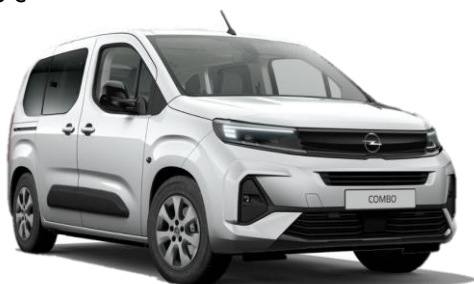
Šedá Kontrast (F4M0) 500 €