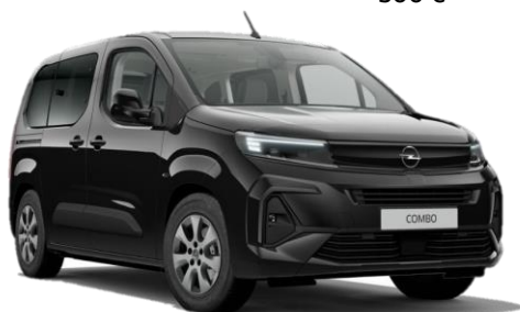
Čierna Karbon (9VM0) 500 €