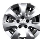
16" x 6,5 disky z ľahkej zliatiny Viana (DZSD)