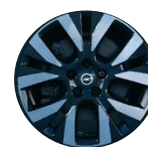
17" x 7,0 disky z ľahkej zliatiny (DZG7)