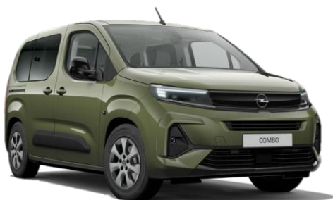
Zelená Sirkka (4QM0) 500 €