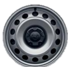
16" x 6,5 šedé ocelové disky so stredovými krytmi (DZQR)