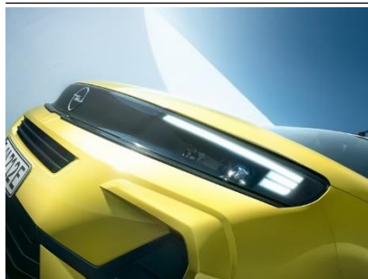
IntelliLux LED PIXEL